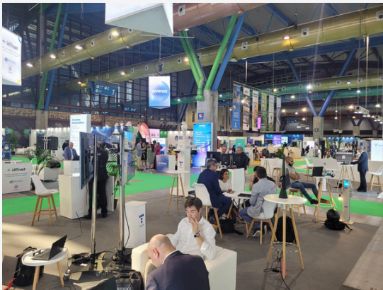
BESUCH GREENCITIES 2023 VISITA GREENCITIES 2023

VIDEOTREFFEN MIT ENDESA VIDEOENCUENTRO CON ENDESA