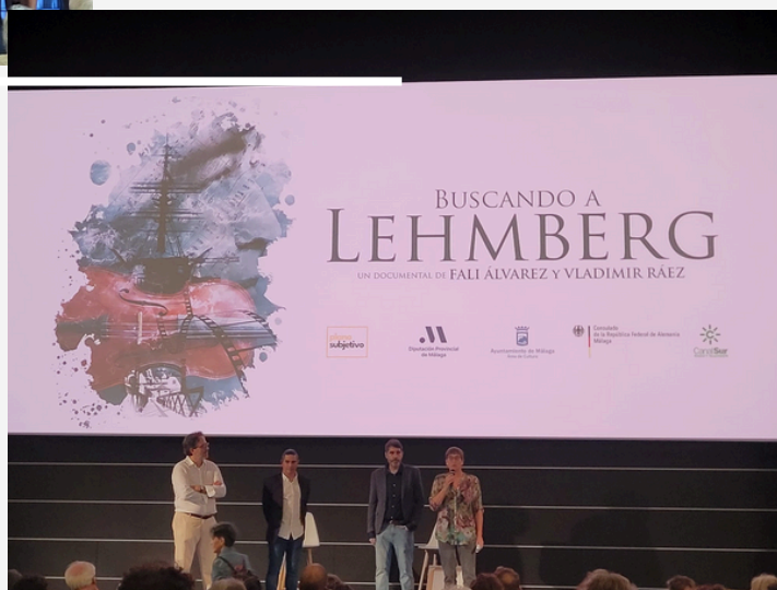
PRESENTACIÓN DOCUMENTAL “BUSCANDO A LEHMBERG”