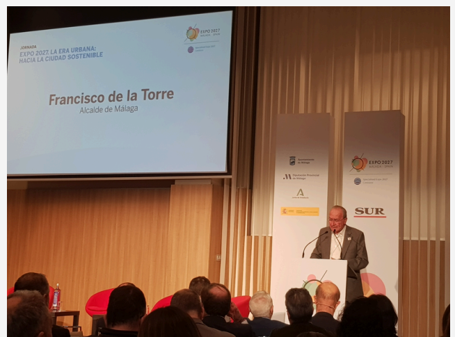
UNTERSTÜTZUNG DER KANDIDATUR VON MÁLAGA FÜR DIE EXPO 27

RECEPCIÓN DE LA EMBAJADORA ALEMANA EN EL BUCUE ESCUELA GORCH FOCK EN CÁDIZ