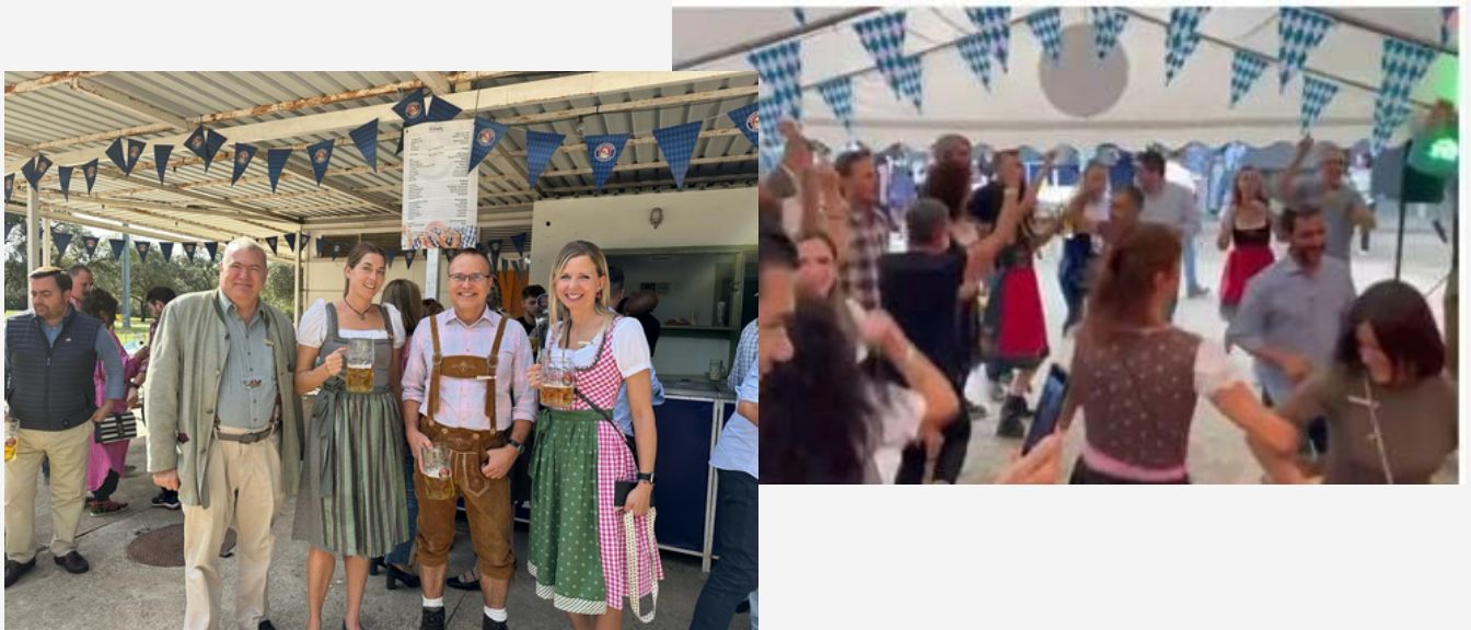
TEILNAHME AM OKTOBERFEST, ORGANISIERT VOM FORUM SEVILLA ASISTENCIA A OKTOBERFEST ORGANIZADO POR FORUM SEVILLA