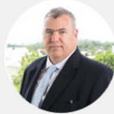
FERNANDO FRÜHBECK PRÄSIDENT