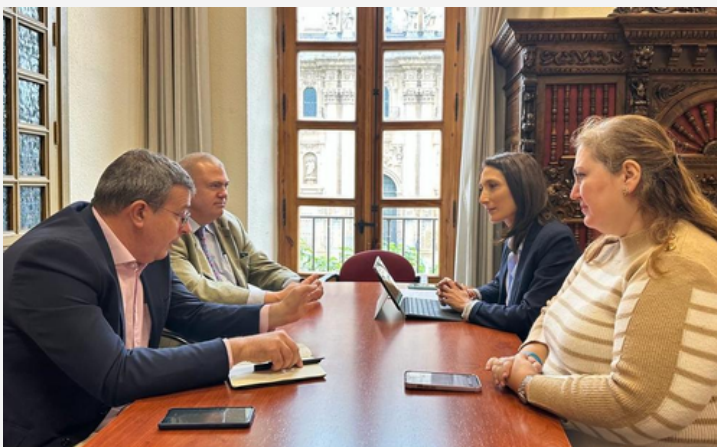
TREFFEN MIT DEM STADTRAT VON JAÉN ZUR ORGANISATION DES ANDALUSISCHEN TREFFEN DEUTSCHER UNTERNEHMEN

ACTO DE APOYO A LA CANDIDATURA DE MÁLAGA A LA EXPO 27