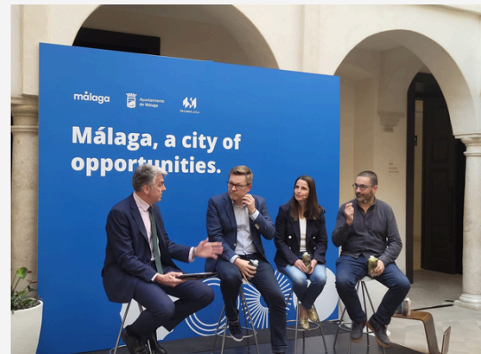
INTERNATIONALES TREFFEN STADT MALAGA ENCUENTRO INTERNACIONAL AYUNTAMIENTO DE MÁLAGA