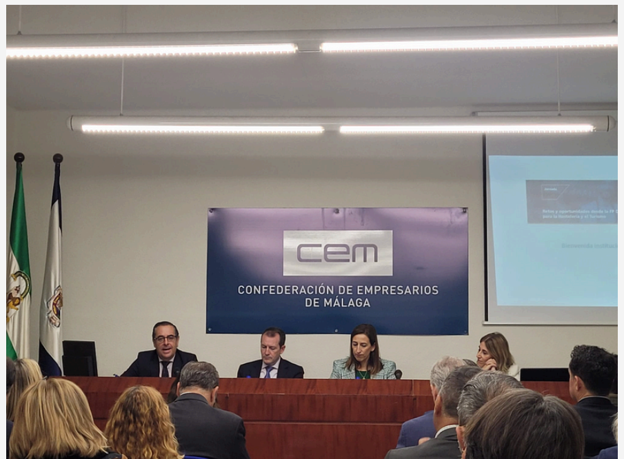
DUALE AUSBILDUNG TREFFEN CEM ENCUENTRO FORMACIÓN DUAL CEM