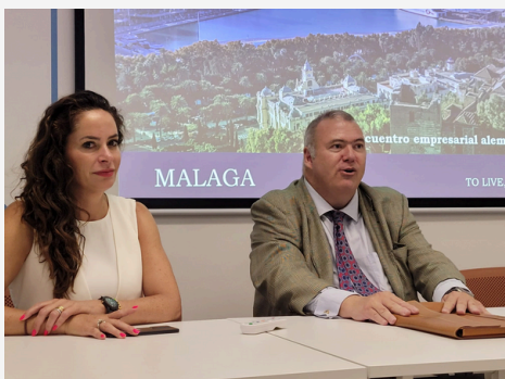
WIRTSCHAFTSTAG JUNI 2023 JORNADA EMPRESARIAL JUNIO 2023