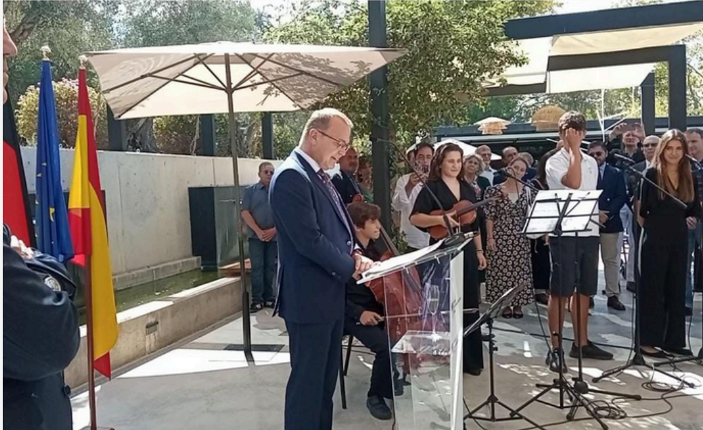
TAG DER DEUTSCHE EINHEIT DÍA DE LA UNIDAD ALEMANA