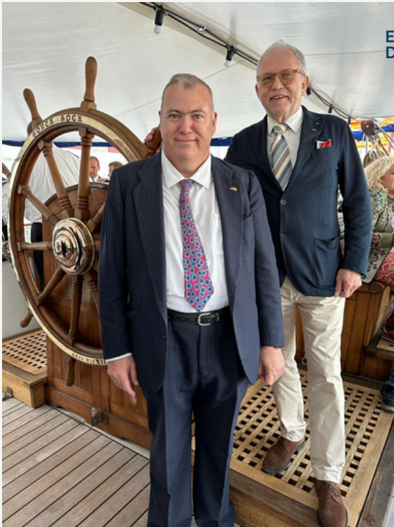
EMPFANG DER DEUTSCHEN BOTSCHAFTERIN AUF DEM SCHULSCHIFF GORCH FOCK IN CADIZ

RECEPCIÓN DE LA EMBAJADORA ALEMANA EN EL BUCUE ESCUELA GORCH FOCK EN CÁDIZ