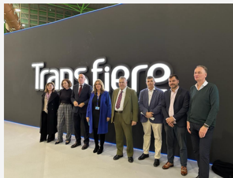
BESUCH TRANSIFIERE 2023 VISITA TRANSIFIERE 2023