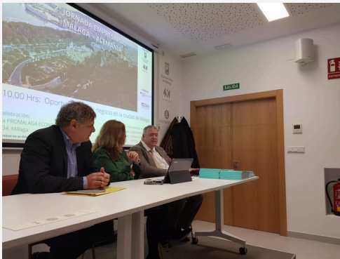
WIRTSCHAFTSTAG JANUAR 2023 JORNADA EMPRESARIAL ENERO 2023