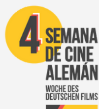
4. DEUTSCHE FILMWOCH 4º SEMANA DEL CINE ALEMÁN · MÁLAGA