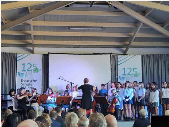
125 JAHRE DEUTSCHE SCHULE 125 ANIVERSARIO COLEGIO ALEMÁN