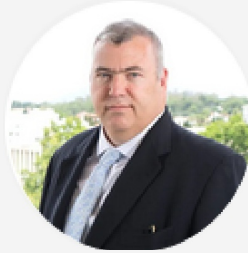
FERNANDO FRÜHBECK PRÄSIDENT · PRESIDENTE